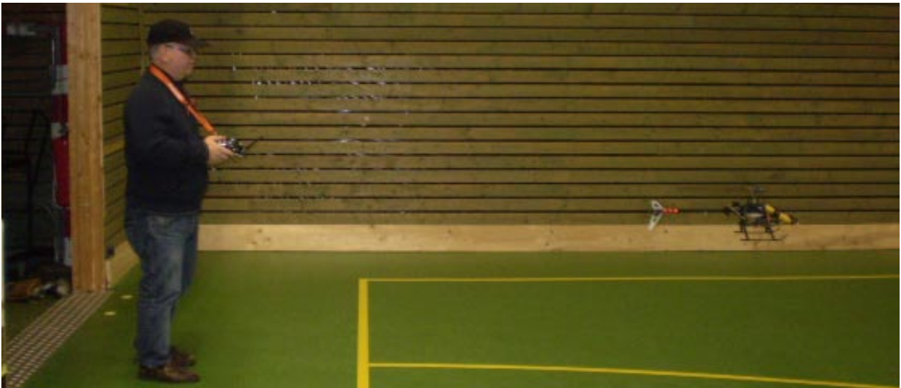
Gide är stenhårt koncentrerad för att hålla sin helikopter på rätt köl.