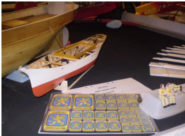
Här ser man aktern på Sotarns väldiga skonare, sedan Georgs lustjakt, NMKs dekalark och längst till höger gubbarna till S18.