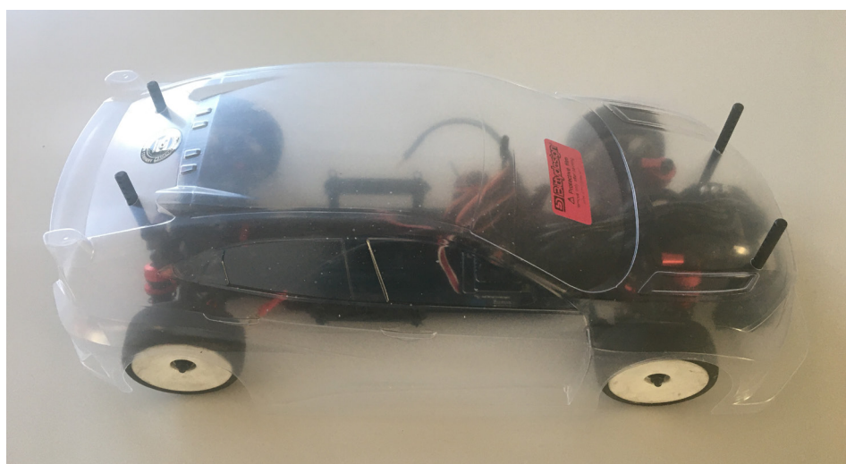
Pjerres nya bil som tomten kom med i förtid!