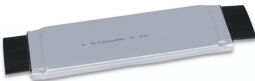
SLS Speed 5100, det enda som fungerar över 300Ampere!