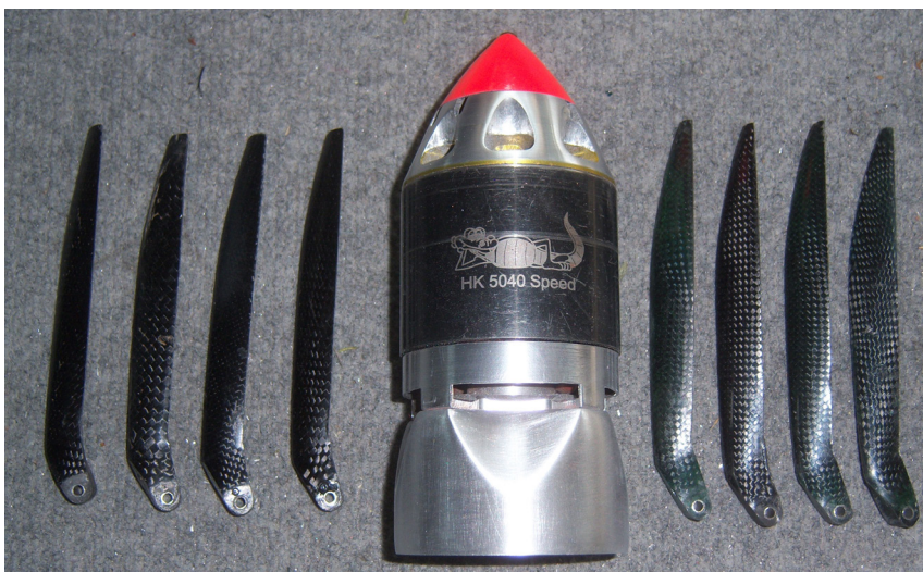
Min "nya", bättre beg motor. Mosar ur sig ca 19 hkr i flera sekunder!