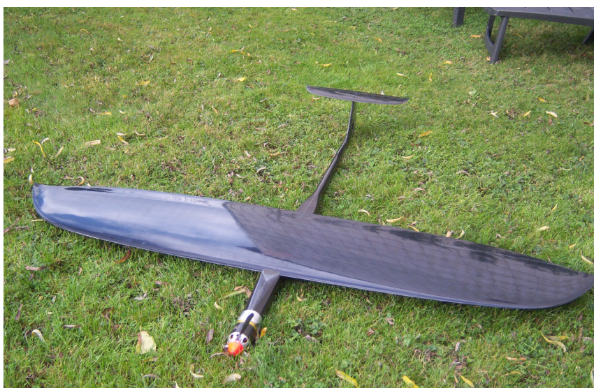
Min kommande maskin inför satsningen mot 500 km/h-vallen!