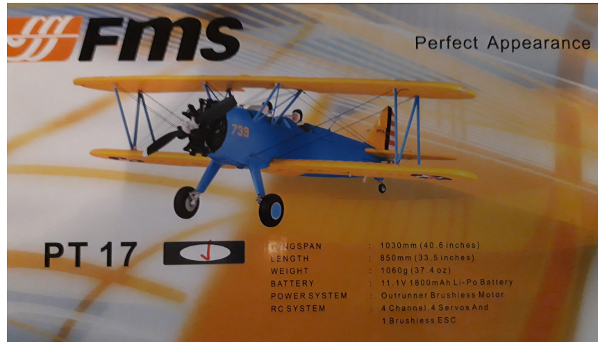
PT-17-byggsatsen ligger i källaren och väntar på att bli byggd och flygfärdig!

iX12:an stöder inte DSM2-protokollet längre. Men den har Android