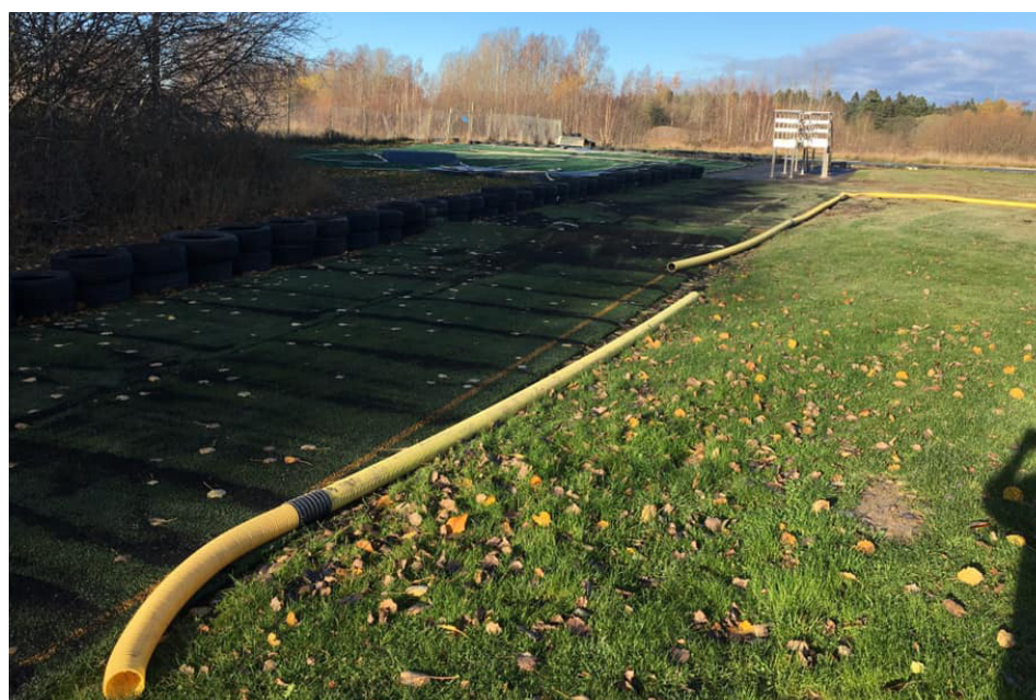
Bilsektionens medlemmar har varit flitiga under året och gjort iordning flera olika banor.