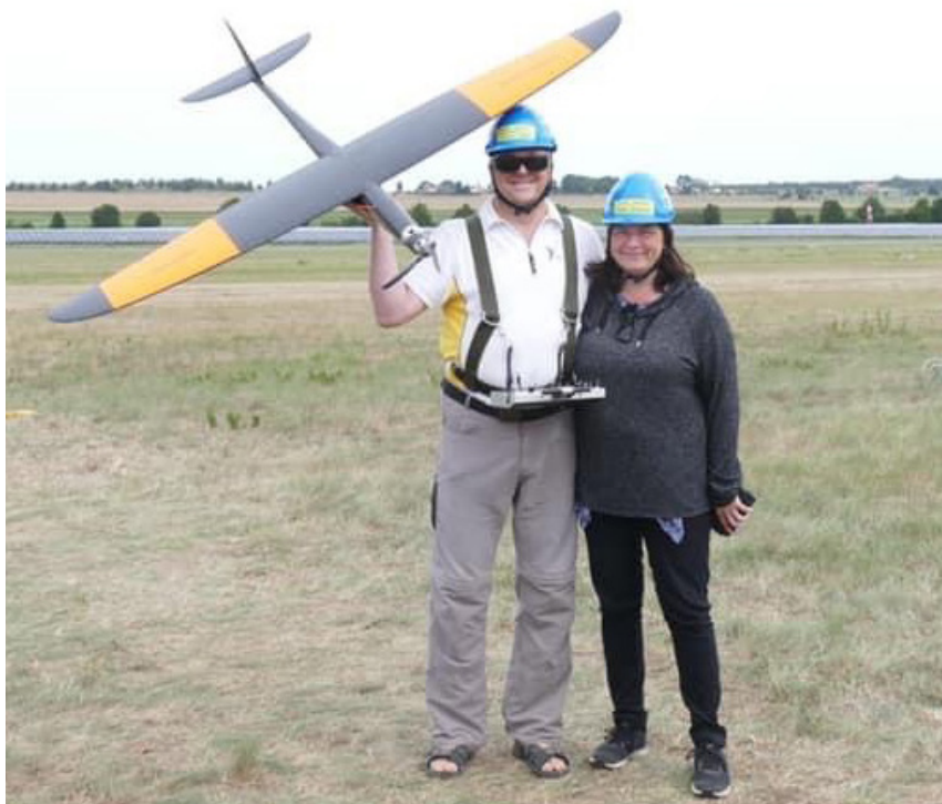
Team NMK Sweden står klara för start. Vad hjälmarna skall skydda mot en 4,5 kg modell i över 500 km/h vet jag inte... men det är ett regelkrav.

I helikopterklasserna vann världsrekordinnehavaren Robert Sixt bägge klasserna med 300,00 km/h i 42 Volt