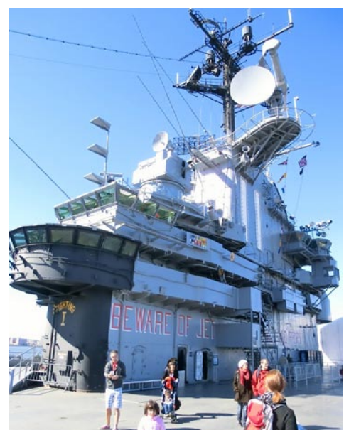
Intrepids imponerande brygga.