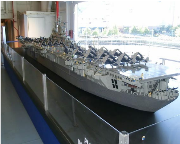
Originellt modellbygge – Intrepid av legobitar.