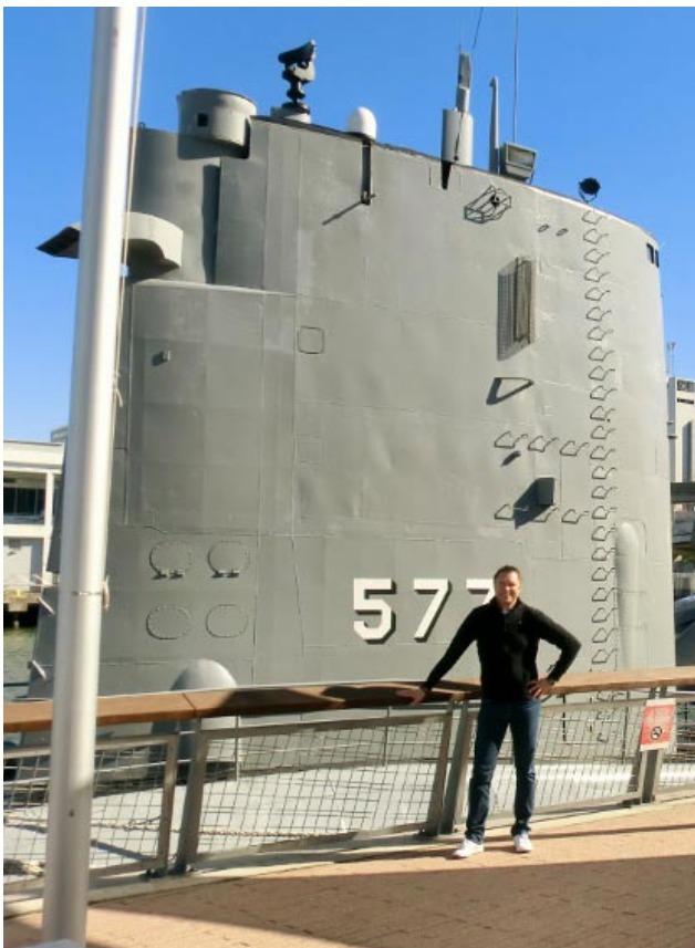
Amerikaresenären poserar vid ett ubåtstorn.