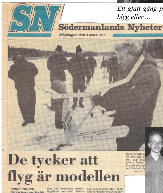
Att ha goda kontakter med massmedia är aldrig fel. Då kan man få så här fin reklam för verksamheten.