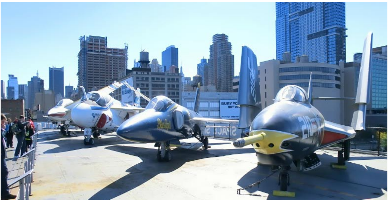
Några plan uppställda på flygdäck med New Yorks skyskrapor i bakgrunden.