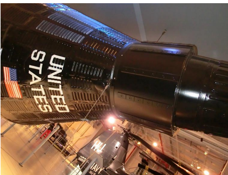
En rymdkapsel finns också att beskåda under däck.