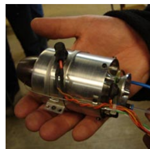
Motorerna blir bara mindre och mindre ...

TRADITIONENLIGT AVNJÖTS årets lussekaka i lokalen på Brandholmen. Princess Konditori bjöd på kaffe, lussebullar och specialdesignat pepparkashjärta. Smakade utmärkt tyckte det 30-talet medlemmar som samlats.