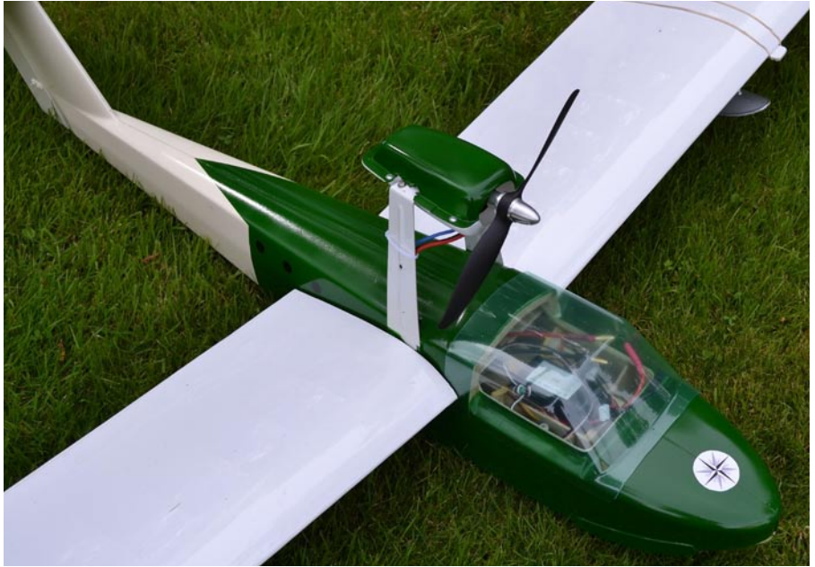
Här ser man tydligt elektronikens placering genom plasthuv. Efter badet var fartreglaget bortom räddning medan mottagaren och motorn klarade sig

Efter ungefär 12 – 15 sekunder steg, likt havsguden Neptun, en grön- och vitmålad flygbåt, sakta upp genom