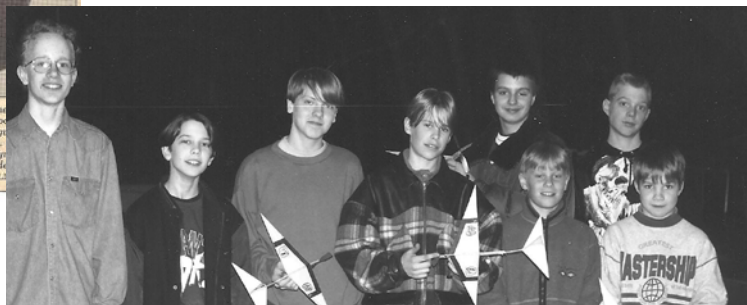
Ungdomsverksamheten var tidigare mycket aktiv och här ser man ett glatt gäng från den tiden. Någon som känner igen sig?