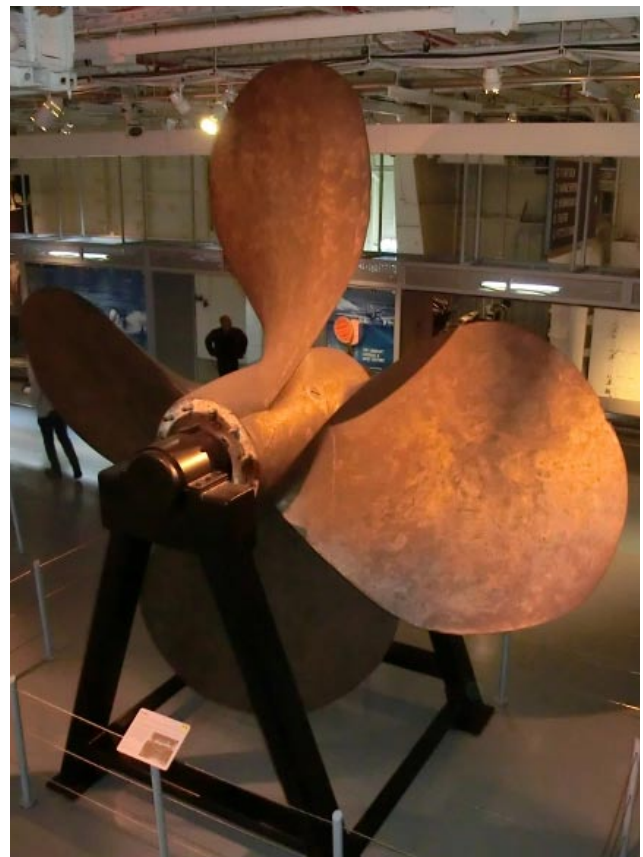
Rejåla grejor för att få fart på skeppet.