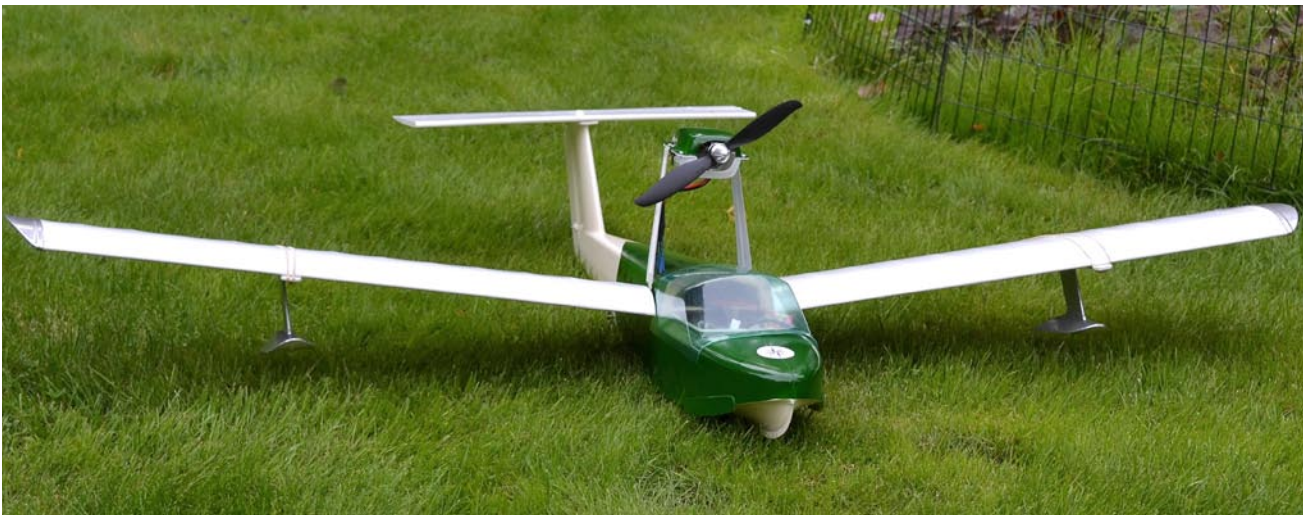
En stilig maskin, men med svåra flygegenskaper. Motorns höga placering gör att den drar medan kroppen bromsas av vattnet, vilket gör att den har en tendens att stå på näsan innan den kommit i luften.