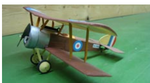
Mats Sopwith Pup tappade höjdroderhornet och fick vila i skamvrån.