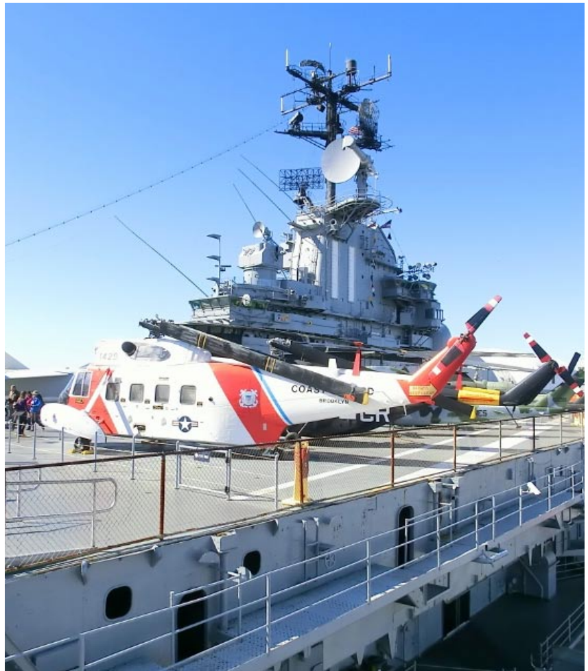
Helikopter på flygdäck.