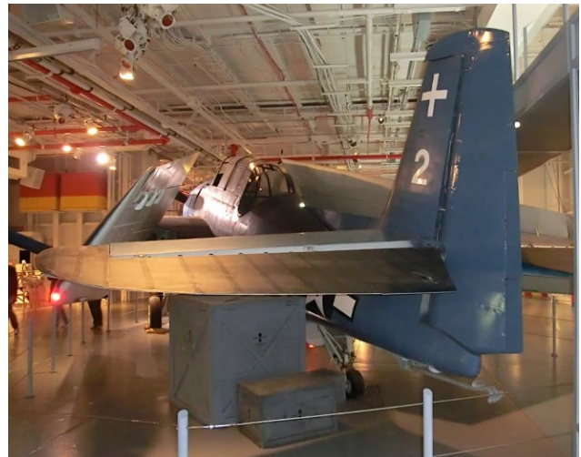
Hopfällbara vingar är praktiskt i trånga utrymmen.