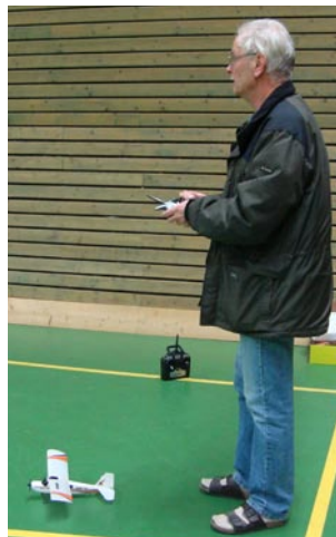
Hasse kollar lufrummet före start.

Vi var en handfull entusiaster som passade på att vädra diverse helikoptrar och flygplan.