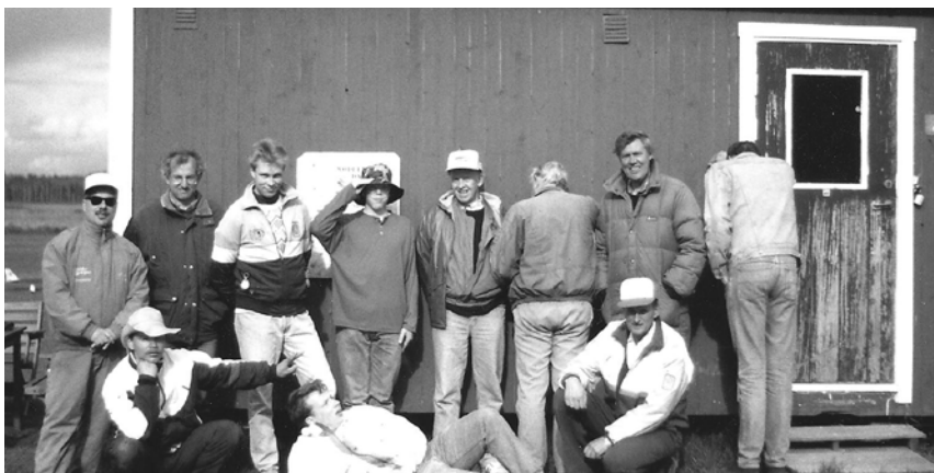
Ett glatt gäng på Radiolanda, Stigtomta. Han längst till höger verkar väldigt blyg eller ...

Det finns ett rikt bildmaterial i en kartong i lokalen på Brandholmen. Titta gärna igenom bilderna. Dessvärre är de utan datering och bildtext, men visar en härlig blandning av snygga byggen, kvaddningar och trevlig samvaro i NMK genom åren. Här kommer ett litet urval.