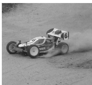
Fartfylld bild från bilsektionens verksamhet.