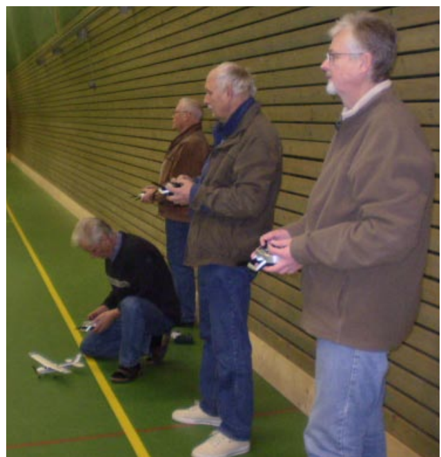
Ibland är det så trångt i luften att somliga landar och sörvar sitt flygplan