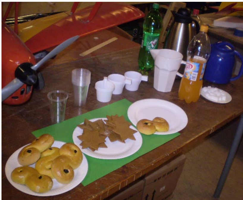
Här har det bullats upp för Luciafirandet! Färska lussekatter och spröda pepparkakor! Mums!