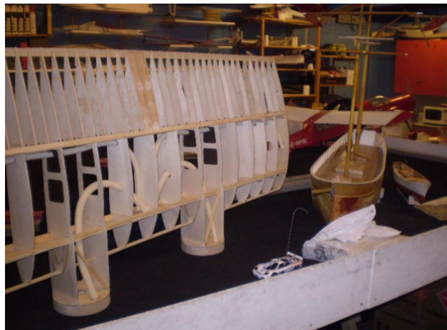
Här är Sotarns bidrag till den improviserade utställningen: Catalinans väldiga mittsektion och den pampiga skonaren Mary Ashburner.