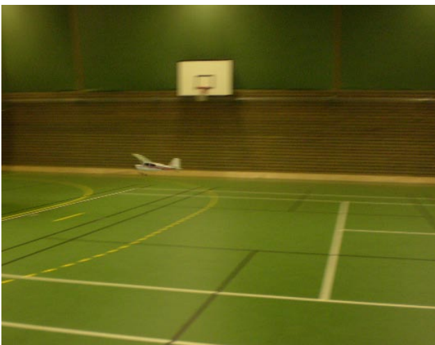
Här går det undan! En lågsniff över spelplanen.

UPPAT 20 PERSONER brukar tacksamt ta tillfället i akt att få luft under vingarna under höstens inomhusflygningar. Det vimlar av Citabrior, Cessnor, helikoptrar och diverse depronoskopelser i luften och en och annan kollision är oundviklig, men resulterar sällan i svårare skador.