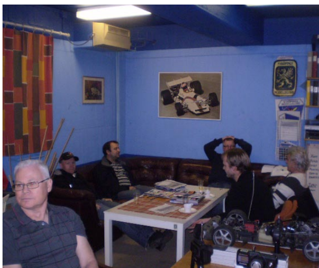
En del av lussefirarna under ivriga diskussioner om motorer, propellrar, anfallsvinklar och byggtekniker omgivna av bilar, båtar och flygplan i lokalen på Brandholmen.