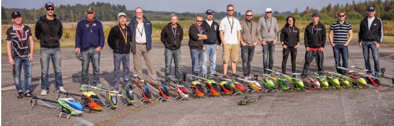
Alla deltagarna uppställda för fotografering.

Den traditionella "Vassröjarträffen" gick av stapeln den 20 september och samlade 15 piloter och 25 helikoptrar. NMKs arrangemang uppskattades för god organisation, mekbord under tak, tillgång till el och god förtäring till humant pris!