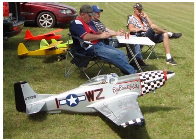
En imponerande Mustang kom också på besök.