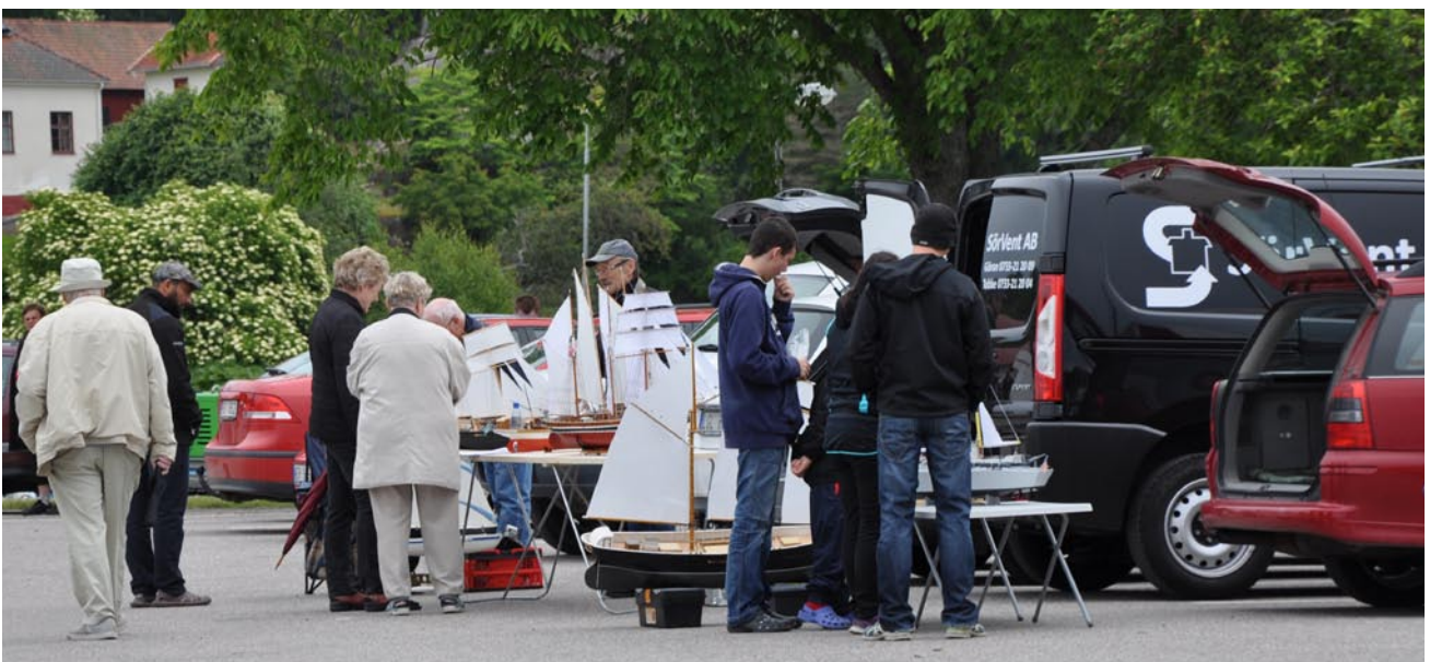
Här står vi och fryser och visar upp våra båtar. Trots vädret var det många intresserade som kom fram och tittade och frågade. Vinden gjorde sitt bästa för att välla ner båtarna från bordet, men det blev ingen incident. Puh!