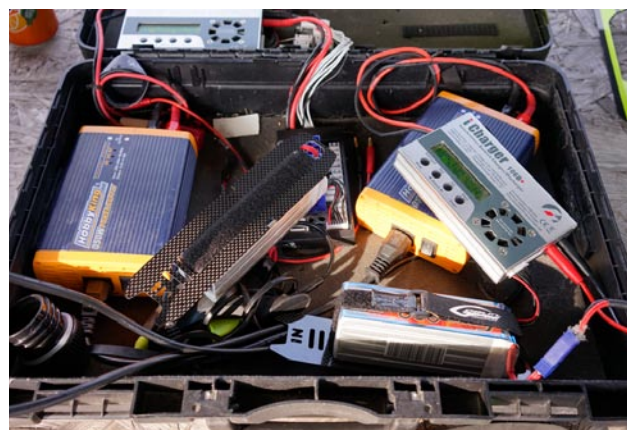
Laddarna fick ett hårt jobb hela dagen!