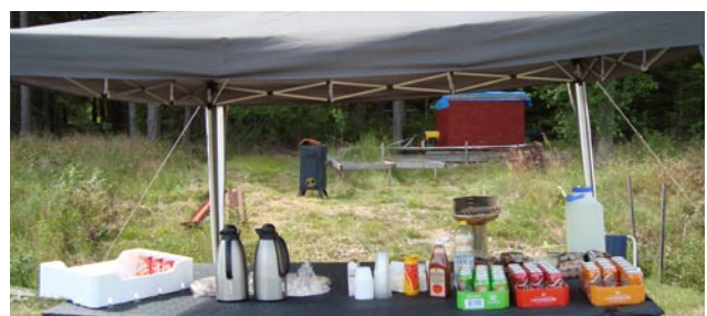
Restaurangen var öppen hela dagen.