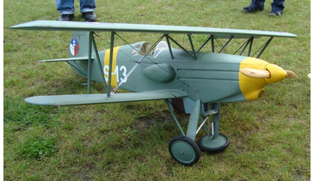
Tuff landning gör inget landningsställ glatt! Aj, aj, aj!