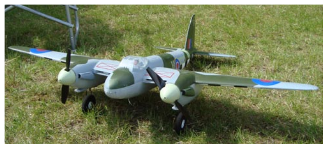
Den tvåmotoriga Mosquiton flög alldeles utmärkt.