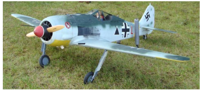
Christer Ls FW 190F2 klar för nya uppdrag!