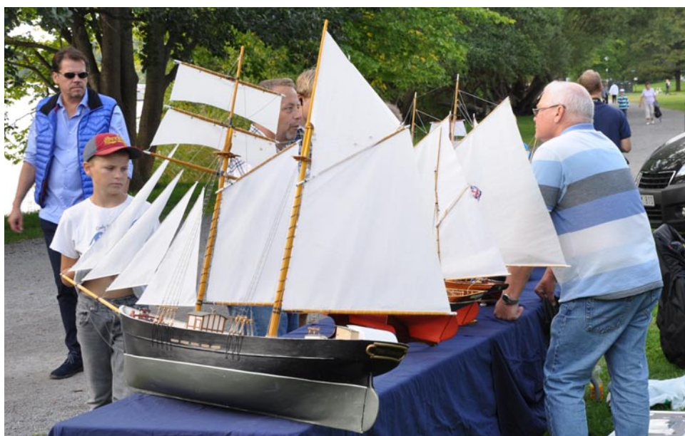
Båtsektionen besökte Sjöhistoriska museets modelldagar och visade upp sina modeller.