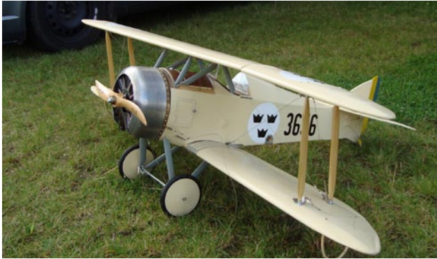
Tummelisa, en liten charmig maskin!

Sommarens andra meeting utnyttjade reservdagen då vädergudarna bestämde så. Men lyckat blev det ändå!