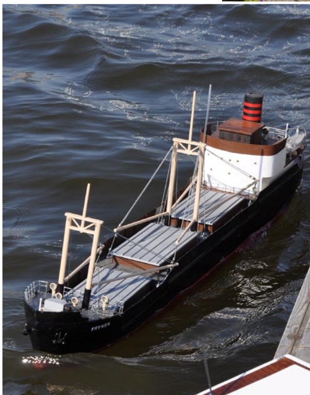
Den här pampiga lastbåten var en välkommen nykomling i gänget och plöjde vågorna med tyngd och pondus.

Vi var ovanligt många som kom till Vattensportens hus för att segla och njuta av det härliga vädret.