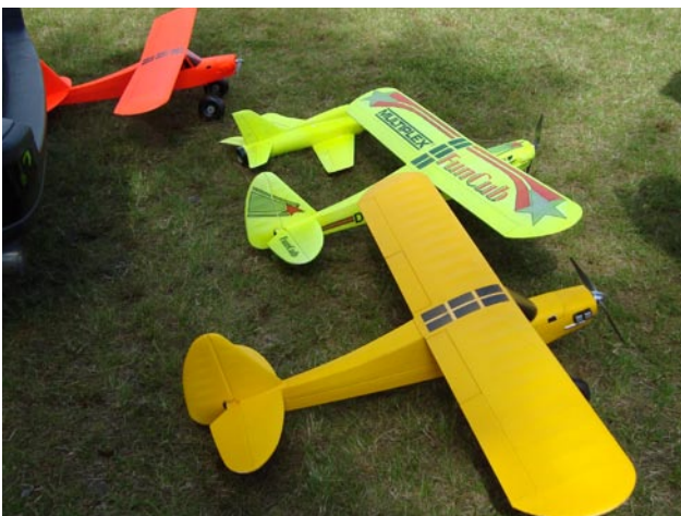
Tre Fun Cubs väntar på att få komma upp i luften.

Här är ett litet axplock av dagens deltagare, flygplan och aktiviteter