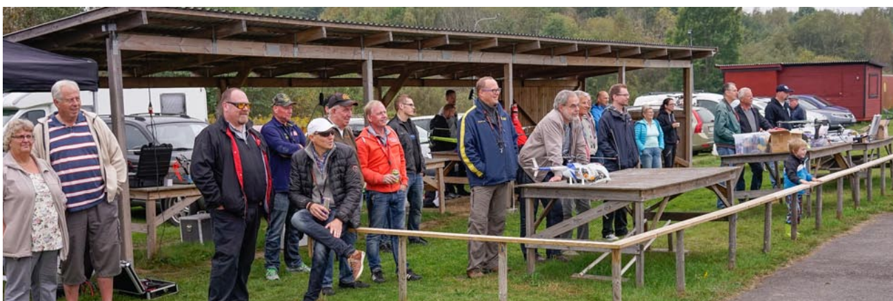
Det var många som sökt sig ut till Brandholmen för att få se de hisnande uppvisningarna av skickliga piloter.