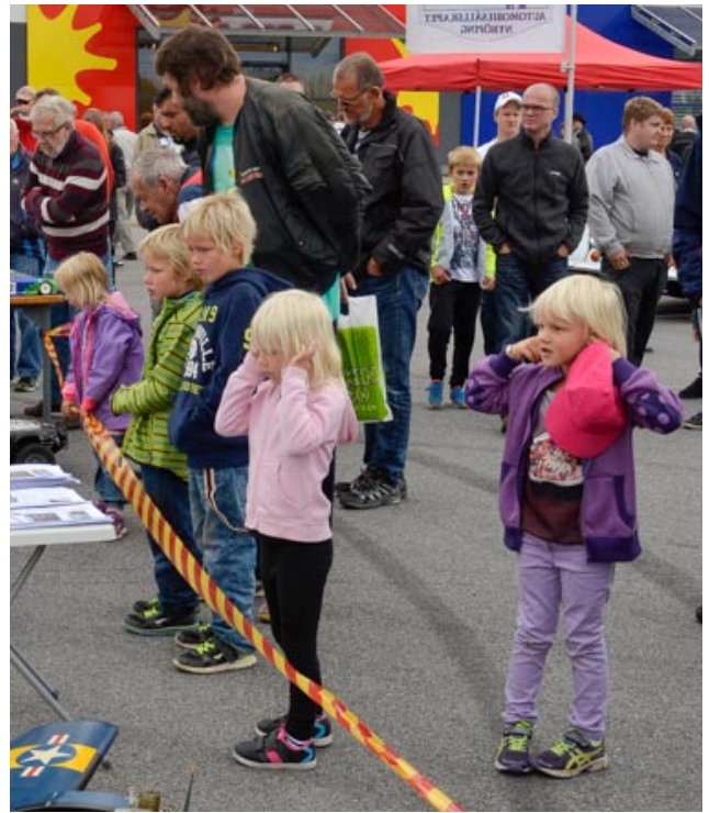
... och det lät väldigt, väldigt mycket tyckte vissa åhörare.