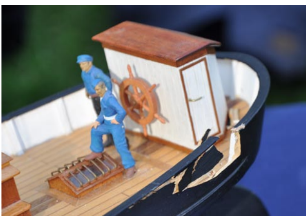
Stockhoms skalabåtsklubb hade prova-på-aktiviteter med skarpstävade motorbåtar för de yngre besökarna. Dessvärre var deras precision inte imponerande, vilket Mats bittert fick erfara. Relingen fick sig en ordentlig smäll, men är reparerad nu.