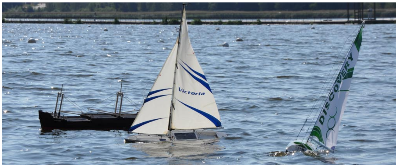
Det var en härlig blandning av flytetyg i alla möjliga skalor och förebilder.