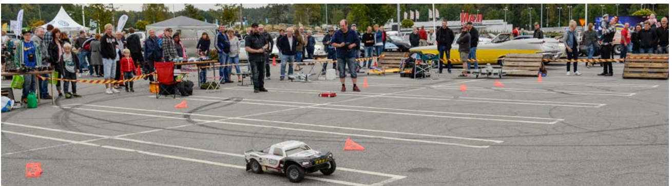
NMKs uppvisning var spektakulär och drog många åskådare!