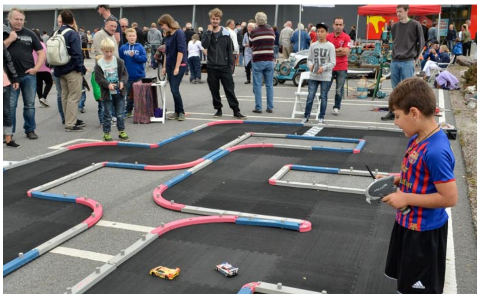
Prova-på-aktiviteterna på Påljungshage gjorde stor succé!