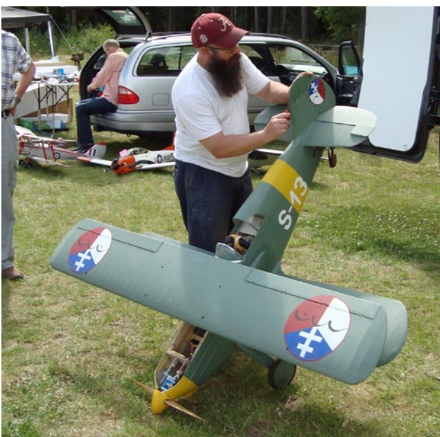
Sotarn gör iordning Avian för flygning.