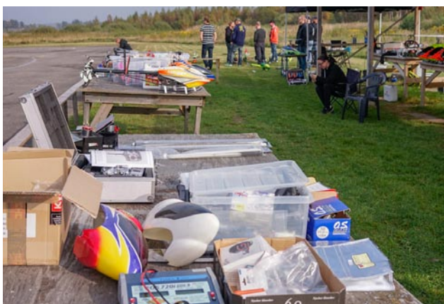
På den improviserade loppisen kunde man fynda.