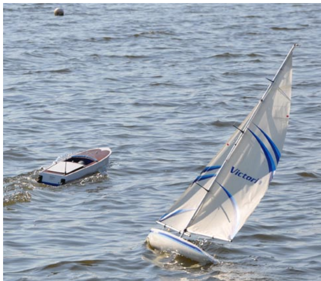
Både motorbåtar och segelbåtar fanns med under dagen. Och tack vare skickliga skeppare skedde inga kollisioner.

Vi var ovanligt många som kom till Vattensportens hus för att segla och njuta av det härliga vädret.