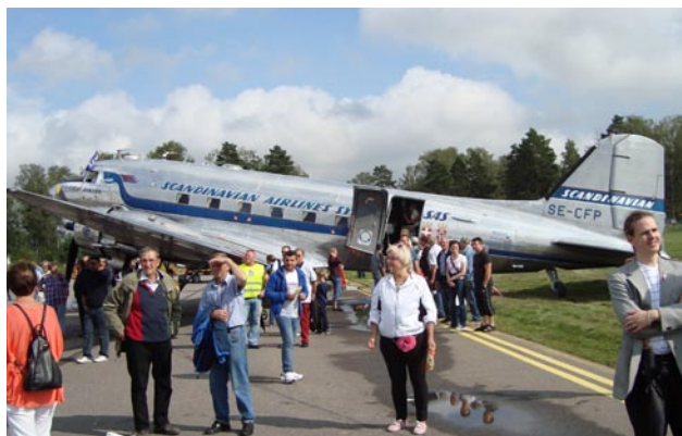
Gamla DC3an "Daisy" kom tuffande från Bromma med en last besökare till F11-dagen.