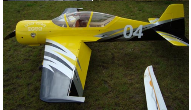
Och slutligen ett axplock av några av de övriga besökarna på Lundafältet.