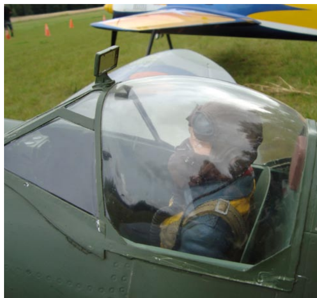
Piloten i Spitfiren spanar efter den lede "fi".

Vi hoppas att nästa år blir lika bra och att Lundaträffen blir en årlig tradition att se fram emot.