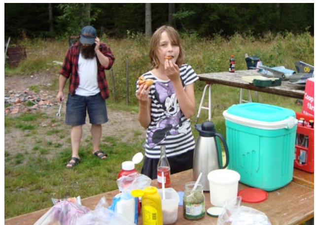
En nog så viktig detalj för ett lyckat meeting är tillgången på läsk, korb och kaffe. Här är kökspersonalen i full fart med att hinna få en bit i magen. I bakgrunden står Sotarn med grilltången i högsta hugg.