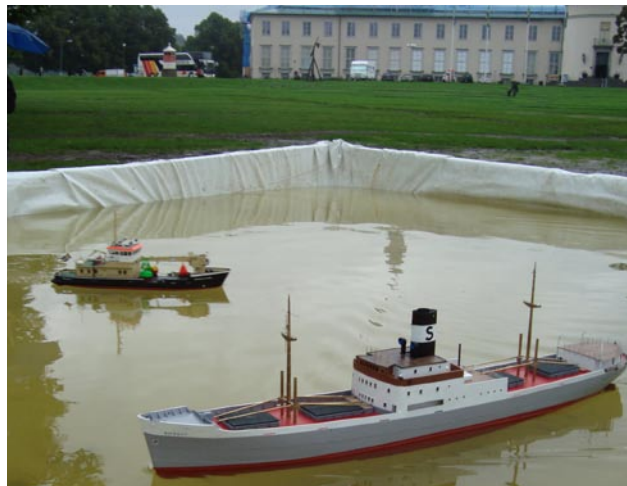
Lastfartyget "Bifrost" väger 27 kg och tar sig försiktigt fram i dammen utanför Sjöhistoriska, som skyntar i bakgrunden.

Men det fanns ett fåtal tappra båtägare som visade upp sina fartyg i dammen som var uppbyggd av en träram och en presenning.