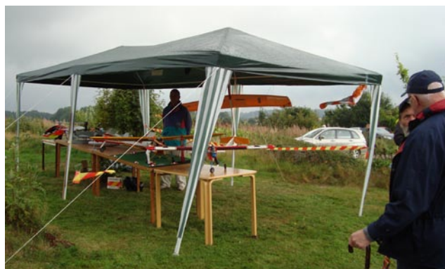
Det var en bedrövlig morgon. Fukten dröp från NMK-tältet och kalla vindar med duggregn gjorde att många frös.

Spitfiren och Mustangen var imponerande att se i luften och att lyssna till! Efter flygningen ställdes dom upp så att man kunde se dem på nära håll.