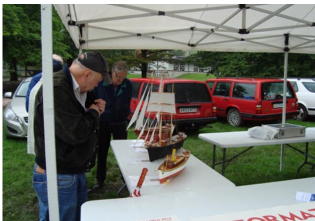
Några intresserade åskådare tittade på NMKs båtar och plockade åt sig av vår presentation av NMK.