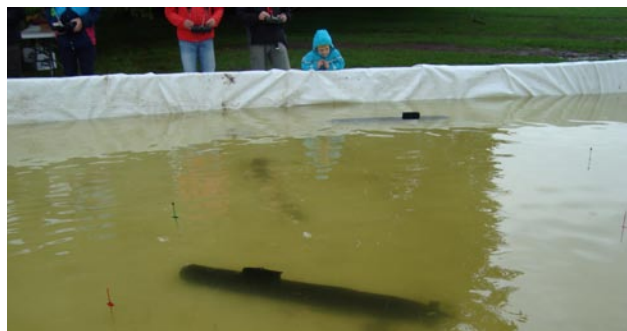
Det fanns två ubåtar som lurade i "djupet".