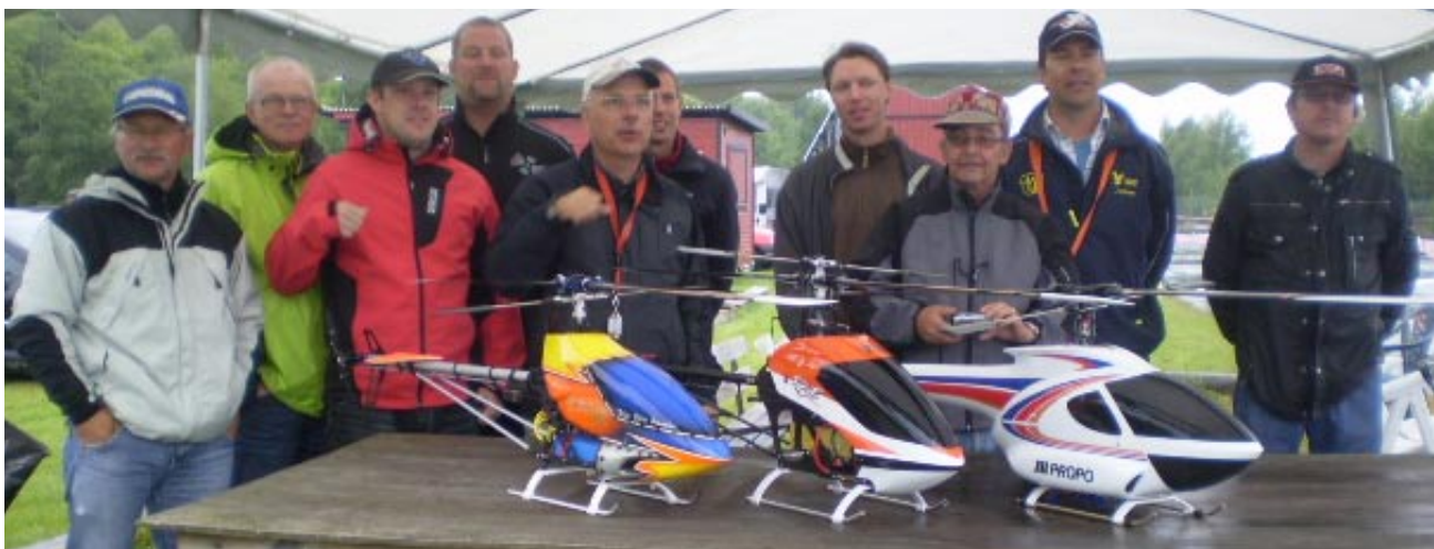
Alla piloter med tre helikoptrar. Det är rejäla doningar med rotorblad som mäter uppåt två meter mellan spetsarna.

DEN 6 OCH 7 AUGUSTI 2011 arrangerade NMK SM/RM i modellhelikopter på Brandholmen. Man tävlade i tre klasser och tio piloter med imponerande maskiner ställde upp. Under lördagen körde man tre flygningar i bra väder, om än med något mer vind än vad som varit önskvärt. På söndagen planerades ytterligare två flygningar, vilka tyvärr fick ställas in på grund av envist regnande. Man baserade alltså resultaten helt på lördagens insatser.