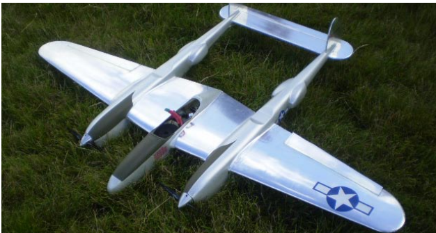
"Bokis blix" skulle man kunna kalla den här Lightningen. Den flög mycket bra och alldeles väldigt fort!