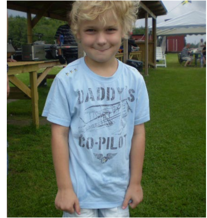
Det ska böjas i tid ...