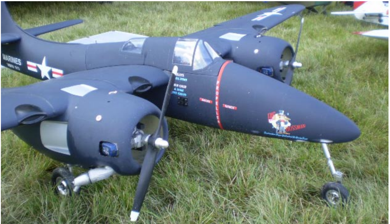
Per Pålssons Tiger Cat imponerade med sin detaljrikedom, två motorer och infällbart ställ. Spv 210 cm, 13 servon, 2 st OS Alpha 110-motorer och en vikt på 11 kilo! Det blev en kort sväng då stället verkade ovilligt att samarbeta. Start och landning gick dock bra. Puh!