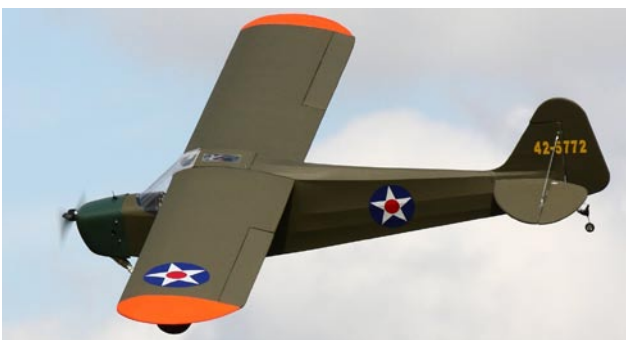
En mycket fin skala-Cub över Lundafältet.