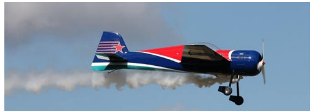
Bosse Karbys YAK 55, spv 3.60, 175 kubiks motor med effektiv rök.