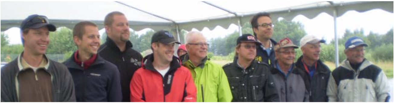
Inga sura miner trots det ständiga regnandet på söndagen! Glada piloter ser fram emot prisutdelningen.