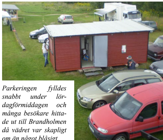
Parkeringen fylldes snabbt under lördagförmiddagen och många besökare hittade ut till Brandholmen då vädret var skapligt om än något blåsigt.

För dem som vill veta mer – gå in på www.f3c.se eller Nyköpings Modellklubbs hemsida www.nykmk.se .