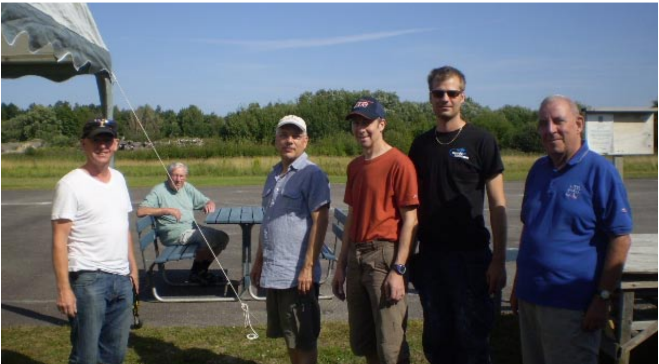
Kontrasternas helg! På fredagen när det här glada gänget förberedde helgen var det strålande sol. Och bilden nedan är tagen på söndag förmiddag när alla väntade på att regnet skulle upphöra så att flygningen kunde återupptas.