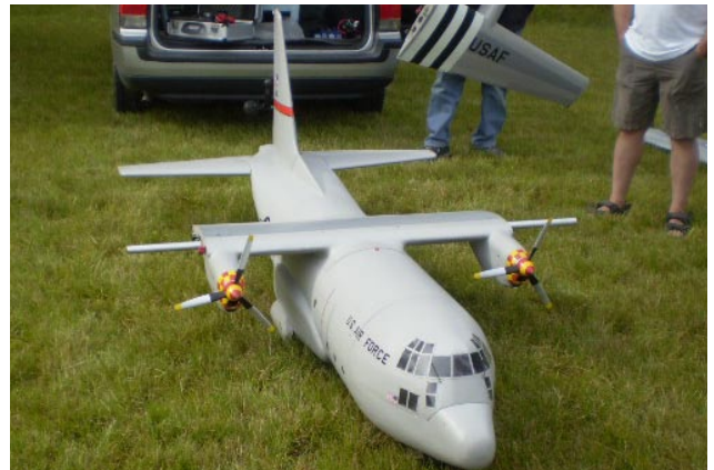
Ivve Hallbergs Hercules flög – fast då med alla fyra motorerna på plats! Filmen finns på NMKs forum.