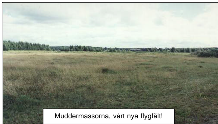
Muddermassorna, vårt nya flygfält!