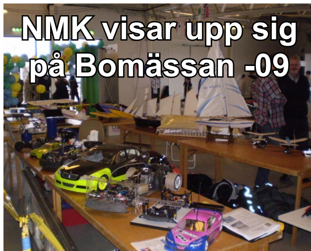
NMKs bilar, båtar och flygplan av alla sorter och format mötte besökarna till Bomässan -09 på Rosvalla.

VID ENTRÉN TILL BOMÄSSAN -09 på Rosvalla fanns NMK och visade upp sig. Vi hade bilar, båtar och flygplan utställda för att visa bredden på vår verksamhet. Nalle och Sotaren satt och byggde på Viggen respektive B25. Många var intresserade och tittade och några piloter som spakat Viggen kom med frågor, upplysningar och minnen.