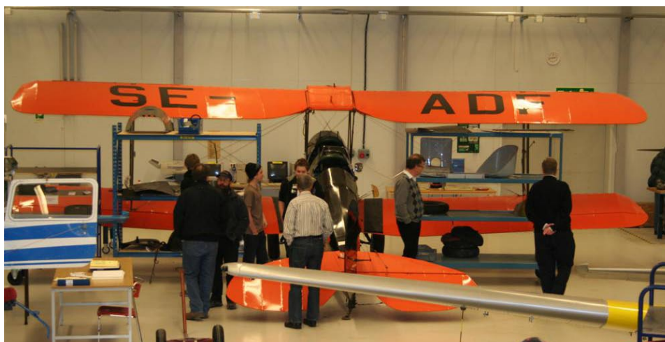
Det plan som drog till sig mest intresse från besökarna var en Tiger Moth från 1932, ägd av KSAK.