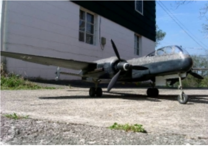
Mikes "Uhu" med en del vädring på plats.