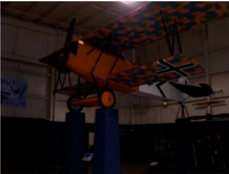
Vi gjorde även ett besök på ett flygmuseum i Birmingham som heter Southern Museum of Flight, www.southernmuseumofflight.org

Fokkern på bilden har en rolig liten historia knuten till sig. När filmen Blue Max skulle spelas in så använde filmteamet en original Fokker som mall för att tillverka fler plan. Och när filmen var klar och några år efter så skulle filmbolaget göra sig av med alla de här kopiorna och de beslöt sig för att skänka bort dem till olika museum. Southern Museum of Flight var intresserade så filmbolaget skickade över detta planet till dem med alla