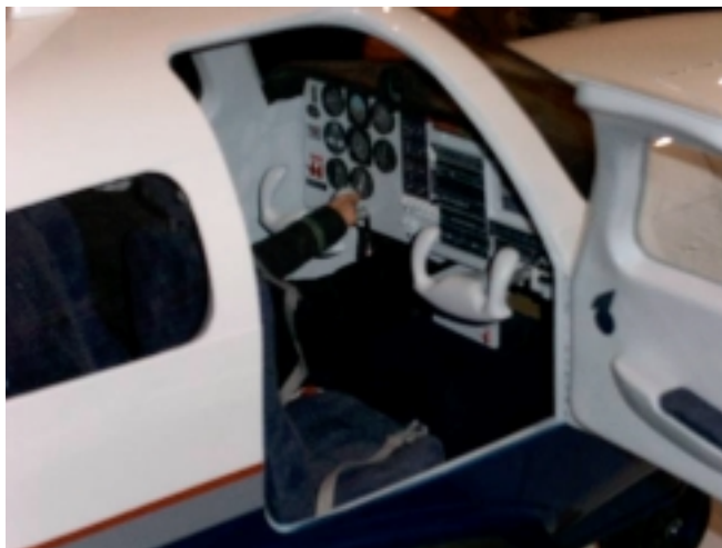
Insidan på en stor Mooney.

Det genomförs även en tävling med modellerna under dessa dagar. Jag tog några bilder på kärorna. På fredagen hade inte alla dykt upp och på lördagen fanns det fler, men då var antalet besökare avsevärt större. Faktiskt så pass många fler att stundtals så gick det inte att komma fram till borden där modellerna stod.