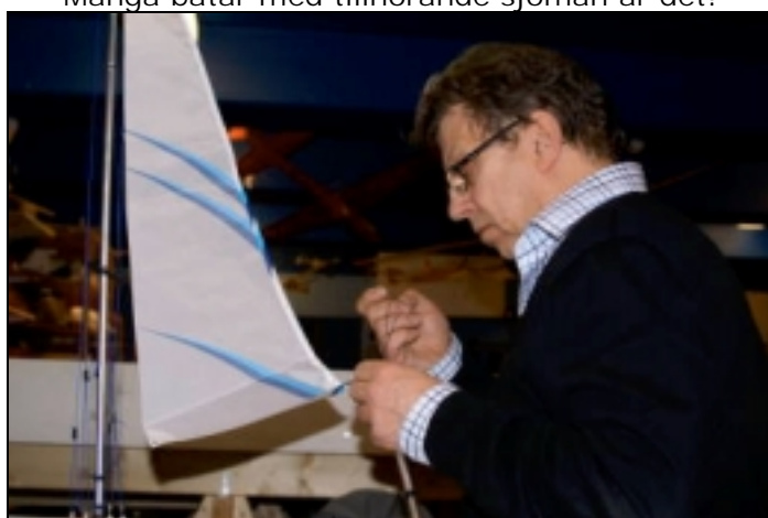
Jag koncentrerar mig!