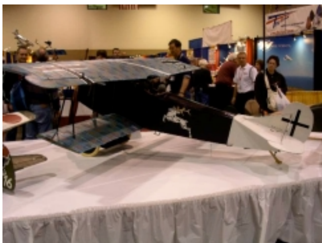
En Fokker D.VII.....givetvis stor....