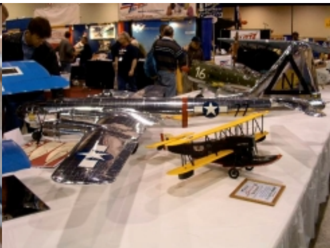
Storleken på modellerna varierar kraftigt.