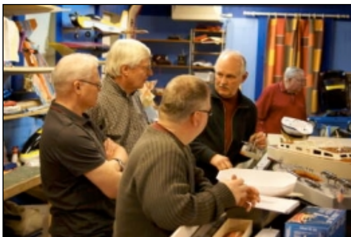
Många båtar med tillhörande sjömän är det!