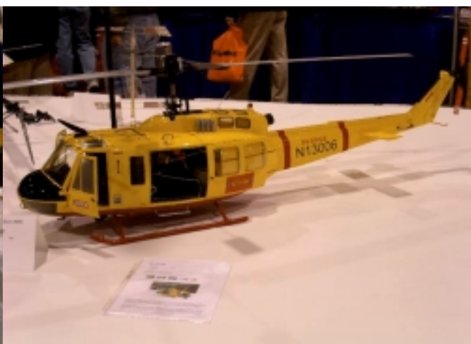
En skalabyggd Huey.

På fredagskvällen så var det dags för RS Scalebuilder middagen och då fick jag träffa ännu fler av alla de som finns på sajten och jag kan ju erkänna att hälften av namnen har jag redan tappat bort. Men det var roligt att få träffa dem och få ett ansikte på alla namnen. ☺