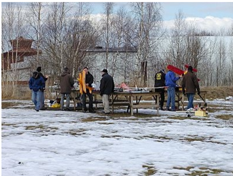
Depå overview, gott om folk å de flesta flög!