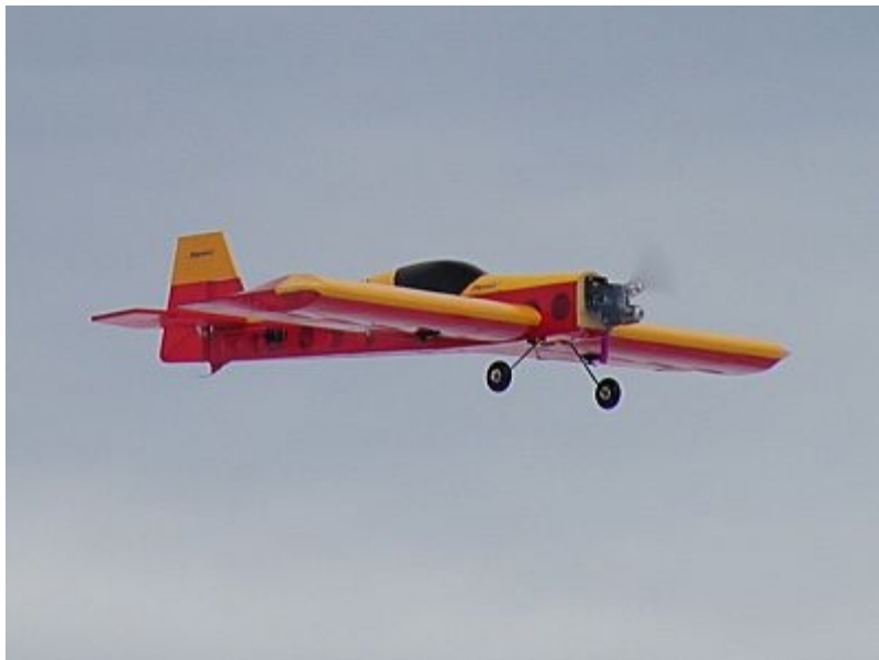
Pontus 3D äntligen i luften, och den flyger ju bra ju!