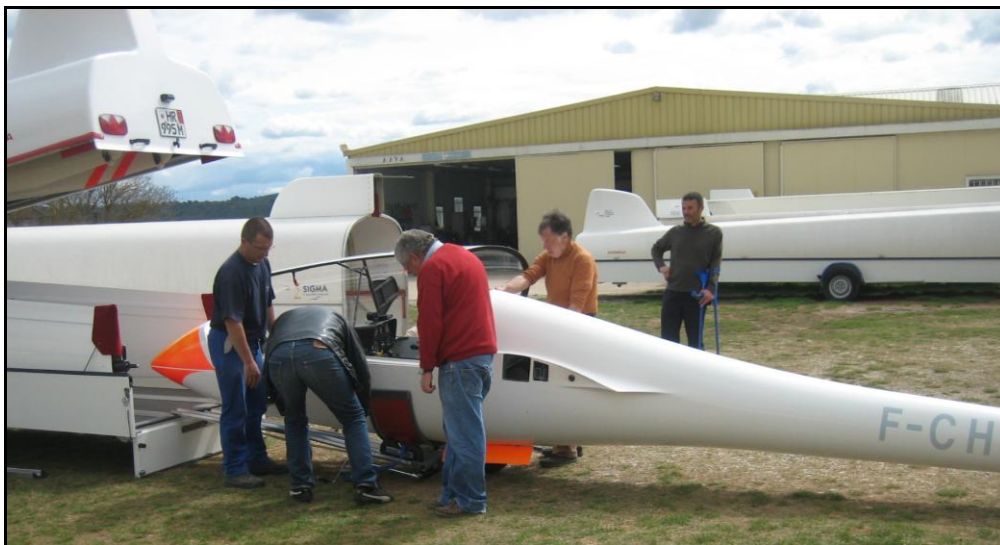
Många hjälpsamma händer såg till att vi fick ordentligt lastat. Bara små justeringar behövdes i vagnen för att allt skulle passa perfekt.