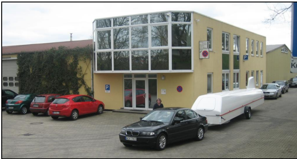
Vår nya Cobravagn är påkopplad hos Spindelberger, söder om Kassel