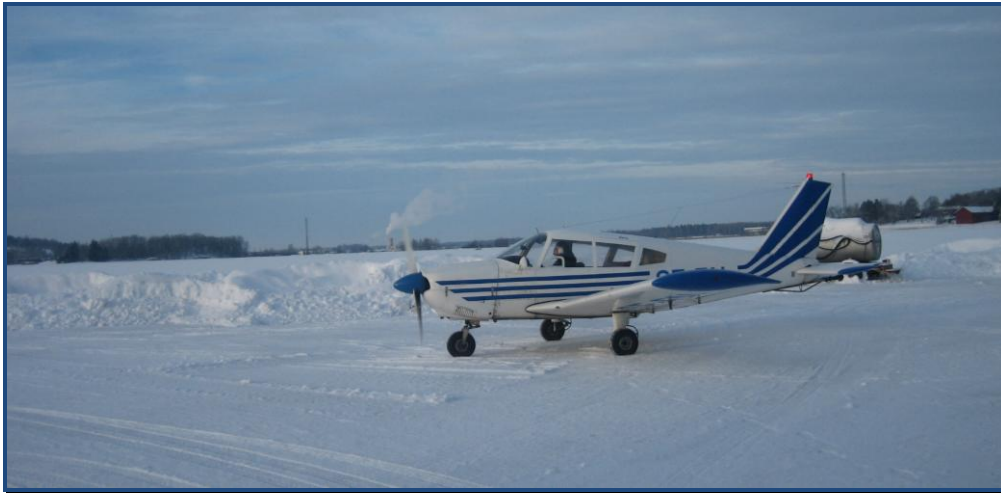
Roland taxar ut för sista flygningen 2010, den 30 dec.

Dynamicen har varit avställd under vintern för att spara en massa ”onödiga” försäkringspremier. Cherokeeen finns än så länge kvar och är inte lika dyr att ha tillgänglig för enstaka flygningar eftersom de fasta kostnaderna fram till försommaren redan är tagna. Men vi är ju inte ensamma om att använda Arbogafältet, så det har varit en del flygning av andra. Saab AB har haft ett tillfälligt behov av att ha en del av banan plogad och vi har fått betalt från dem för att fixa det. Vi har också inlett diskussioner med flygakademien i Västerås om ett samarbete på fältet, som kanske kan ge oss möjlighet att mot ersättning låta dem få tillgång till en del av våra anläggningar. Två representanter därifrån är bokade för ett besök hos oss den 11 mars.