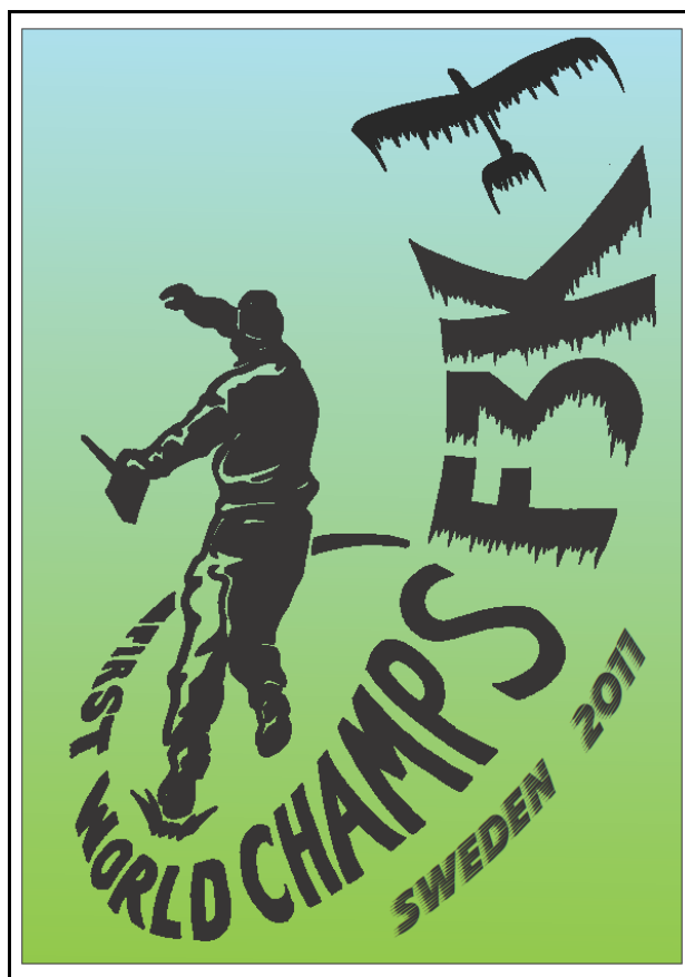
Förslag till poster

Vi ska försöka sammanfatta vad det kommer att innebära för oss och vår vanliga verksamhet och informera om detta separat via vår hemsida.