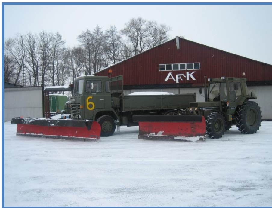
Våra plogar uppställda efter väl förrättat värv.