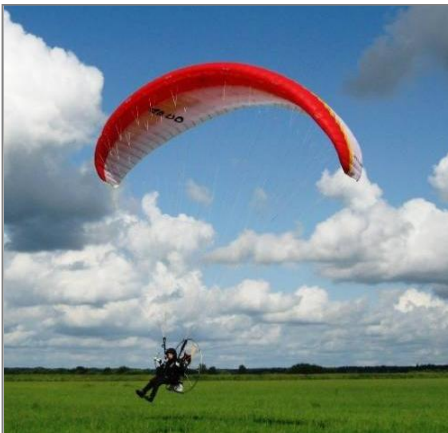
Sådana här flygfarkoster kan det komma att bli många av på fältet i slutet av maj.

De är ju en sorts flygare de här också, även om det kan se lite primitivt ut, och de flyger helst när det inte finns någon termik, på morgnar och kvällar, så vi ska nog kunna samsas om luftrummet och utrymmet på fältet.