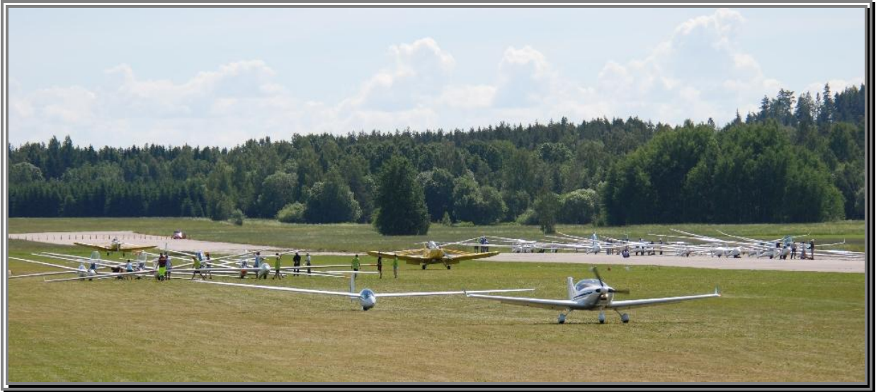
Så här såg det ut i somras när VOB deltog i uppdraget på Arboga Open