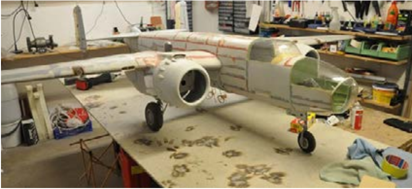
B-25, påbörjad redan 2003, är ett under av tålmodsprövande detaljering!