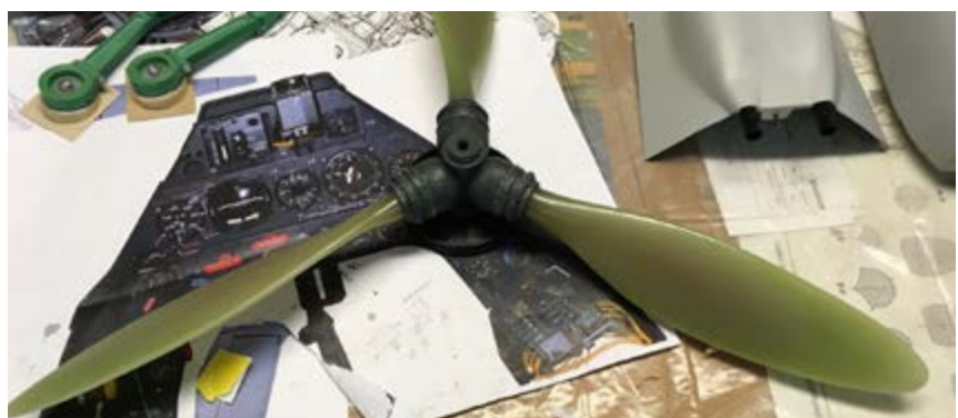
3D-printad propeller och början på cockpit.