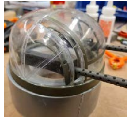
Dubbelkulspruta försvarar B-25:an.