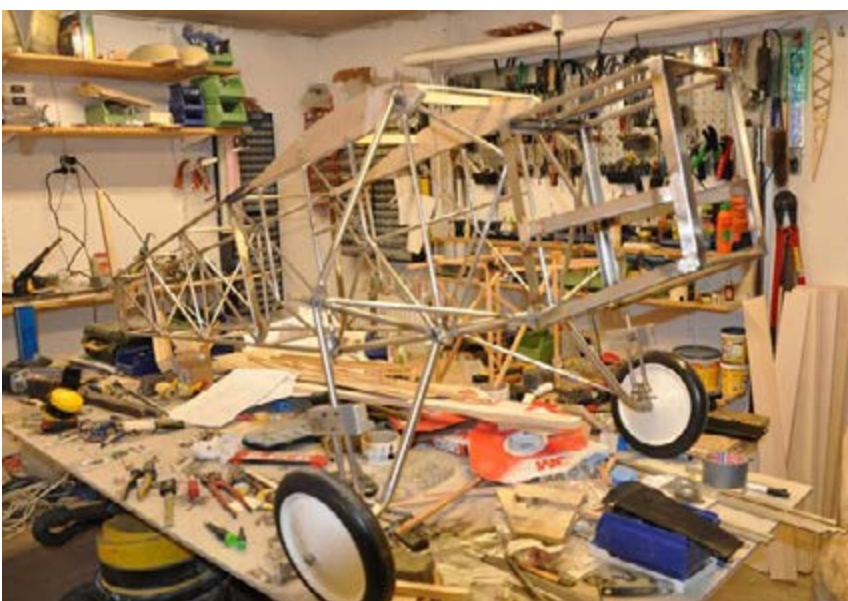
Curtis Robin model B i skala 1:3. Spännvidd 4,17 m!