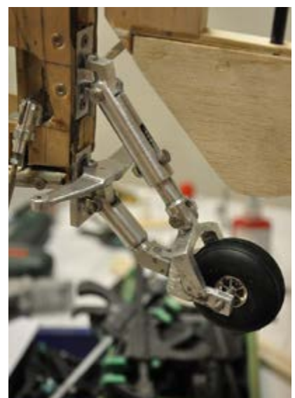
Sporrhjulet till Curtis Robin. Avancerad och kraftig konstruktion!