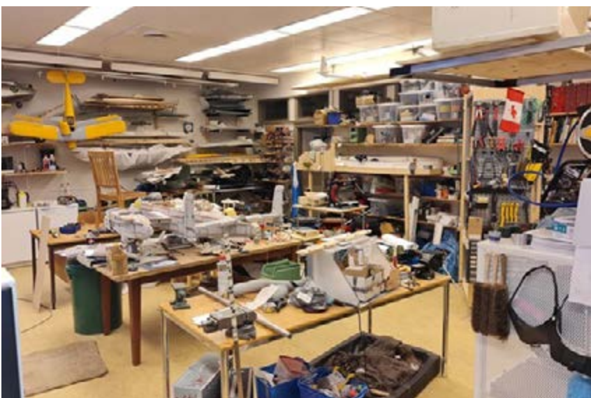
Flera arbetsbord och mängder med hyllor ger utrymme att arbeta och förvara!