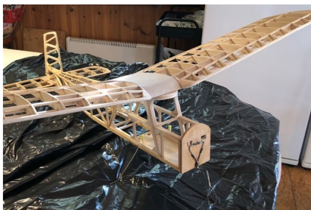
Skyscootern väntar på klädsel, radio och motor.