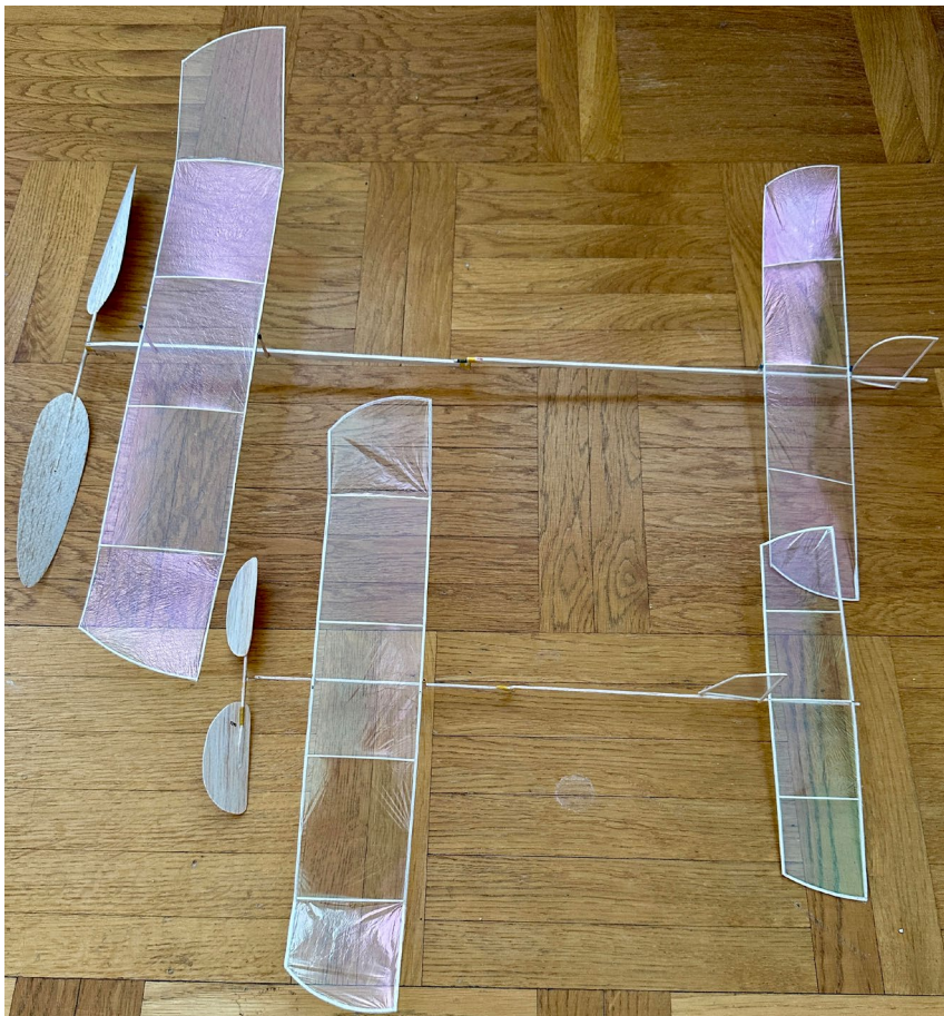
Överst en FIL på 450 mm spv och nedanför en liten A6 på 300 mm.

Nästa steg FIL en FAI klass med max 457mm (18tum) spv. som blir nå-