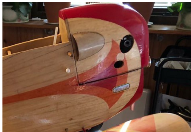
Här i nosen huserar nu en Saito 30 fyrtaktare!